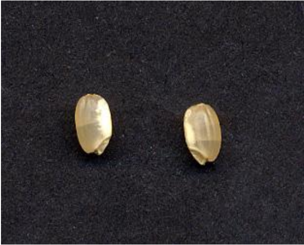
Figura 3a: Fessurazioni nel granello di riso sbramato

Le fessurazioni rendono la cariosside fragile e, durante il processo di lavorazione, il granello si spacca e si formano le rotture. Il risultato finale si traduce in una riduzione della percentuale di riso lavorato a granello intero ed una maggiore percentuale di granelli rotti, con un evidente deprezzamento delle caratteristiche qualitative del lotto di risone.